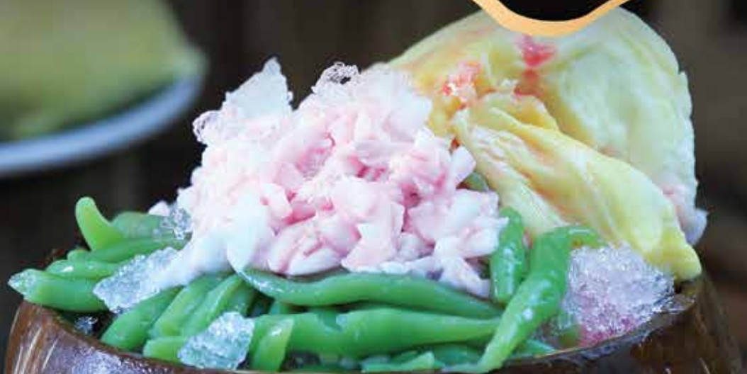
Es Cendol Durian Mandalika