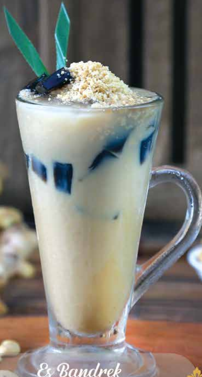
Es Bandrek Tangkuban Perahu