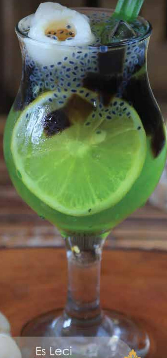
Es Leci Kahuripan