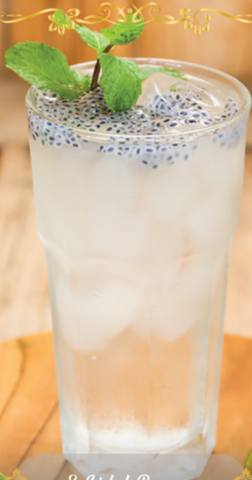
Es Lidah Buaya