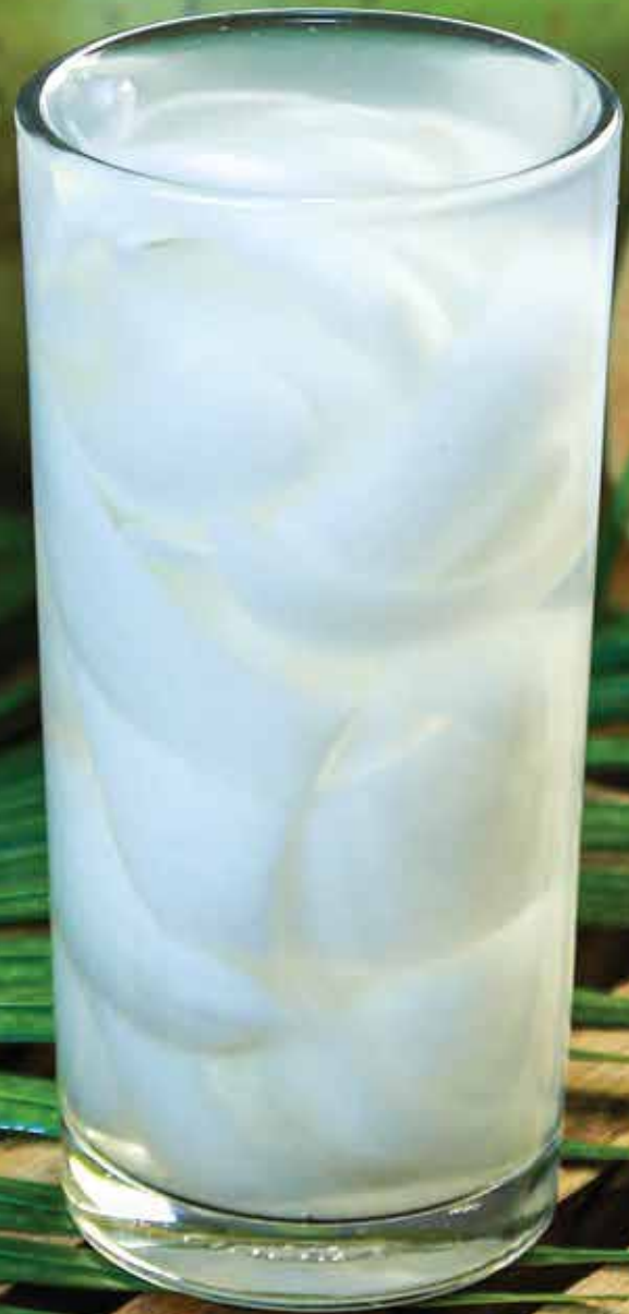
Es Kelapa Gelas