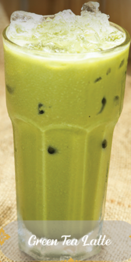
Green Tea Latte