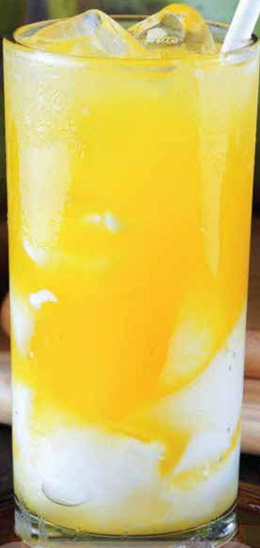
Es Kelapa Jeruk