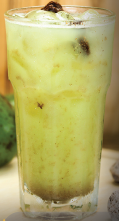
Es Kedondong Kiamboi