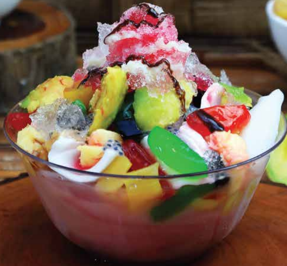
Es Campur Pesisir